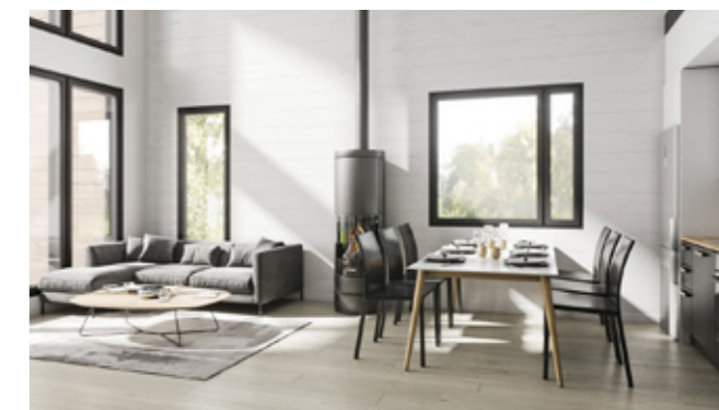
Kuvat kuvituskuvia/suunnittelijan näkemys